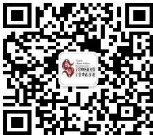
医院微信公众号（服务号）二维码

1. 扫描下方二维码或搜索关注医院微信公众号（服务号），点击进入【医院公众号】—【医院资讯】—【智慧服务】页面。（首次注册需要绑定就诊人信息，请填写准确信息）。